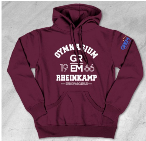
Anschaffung von Schulkleidung für einheitliche Auftritte, z. B. bei Wettbewerben