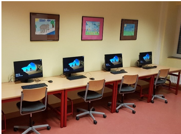
Neue PCs im Selbstlernzentrum

Der Förderverein des Gymnasiums Rheinkamp unterstützt deshalb die Arbeit unserer Schule auf vielfältige Weise: