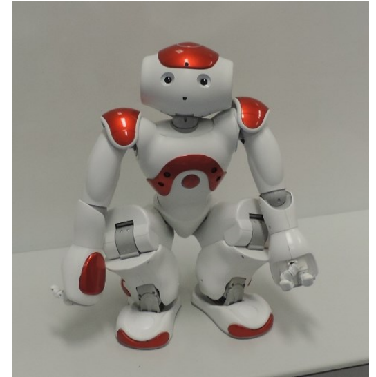
Schulroboter „Gremy“, ein programmierbarer NAO Evolution Roboter